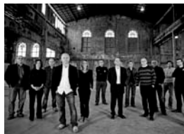
Grup Instrumental de València

Director del Grup Instrumental de Valencia Director de Moderna Música